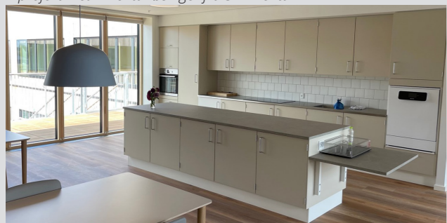
Friplejehjemmet Magdalene Mariehjemmet i Sorø 2023 - ST Skoleinventar har leveret inventar og dokumentation til projektet, som var et DGNB Guld projekt.