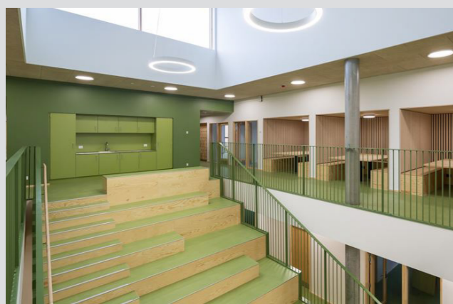
Vrå Skole - Årets skolebyggeri 2022 og et DGNB Guld projekt med inventarløsninger fra ST Inventar

I tabellen fremgår ligeledes hvor ST kan have positiv indflydelse på pointene inden for kriterierne, der udgør ialt 49,2 % af den samlede certificering. Det er ikke alene ST's inventarløsninger der udgør de 49,2 % af pointene, men procentsatserne beskriver, hvor ST's inventarløsninger kan bidrage positivt til pointdelingen i det enkelte projekt. Hvilken specifik indflydelse ST's inventarløsninger har vil afhænge af det enkelte byggeri, herunder de øvrige materialer anvendt i byggeriet.